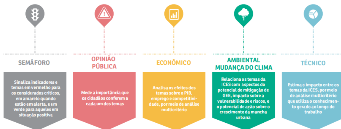
Figura 1 - Processo de priorização da ICES