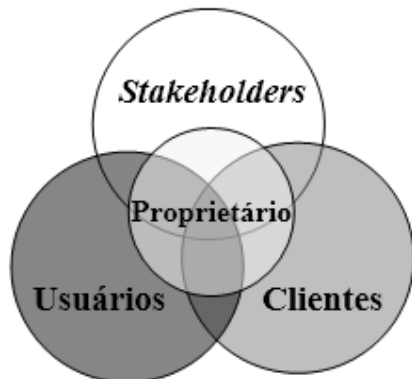
Figura 2 - Estrutura dos Living Labs

Fonte: Adaptado de Nesterova e Quak (2016).