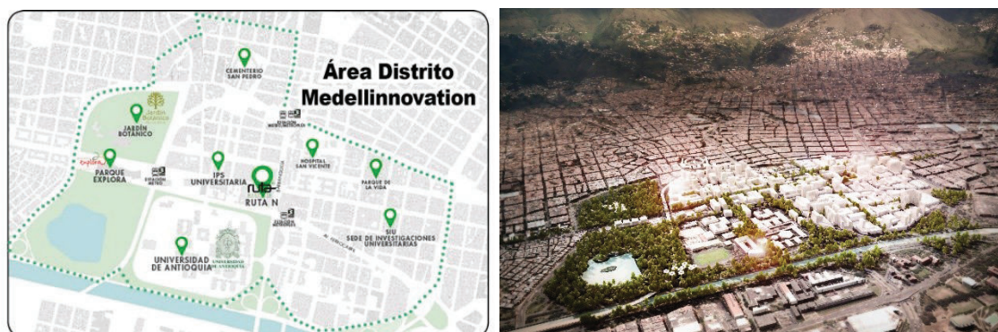
Figura 2 e 3: Mapa da área do Distrito Medellinnovation.

O Distrito apresenta 44.905 metros quadrados de infraestrutura para as empresas que chegam, tanto nacionais quanto internacionais. Como objetivos estratégicos o Distrito buscar: ancorar um ecossistema criativo nas áreas de saúde, energia e tecnologia da informação e comunicação, atrair empresas de alto valor agregado, potencializar uma nova geração de empreendedores de base digital e construir um entorno urbano diverso e aberto onde as pessoas devem estar.